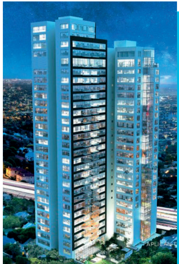
Atlamaya Art Residences - CDMX