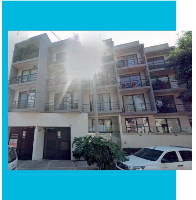
Casa del Obrero Mundial 201, código 2, Col del Valle Nte, Benito Juárez, 03103 Ciudad de México, CDMX