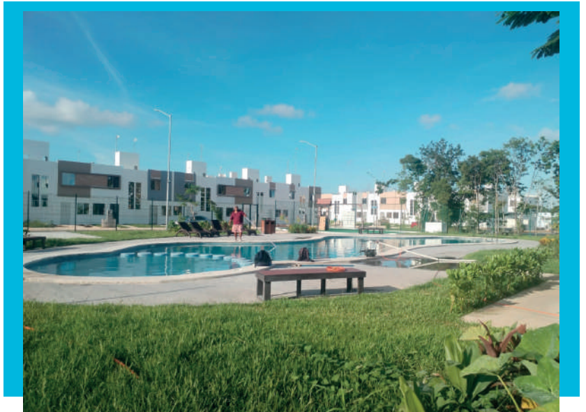
Kusamil - Cancún