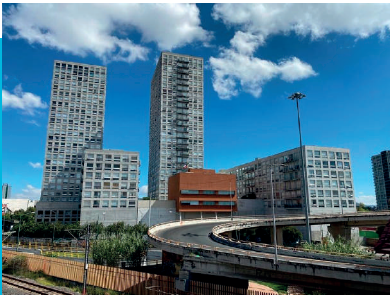
Condominio Puerta Jardín - CDMX