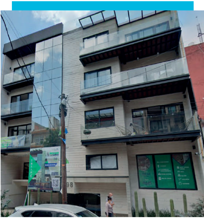
Guanajuato 190, Roma Nte., Cuauhtémoc, 06700 Ciudad de México, CDMX