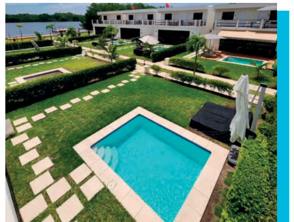
AWA PRIVATE VILLAS