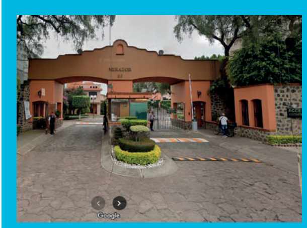
Paseo de las Jacarandas, Paseos Pedregal de Tepepan, 14643 Ciudad de México, CDMX