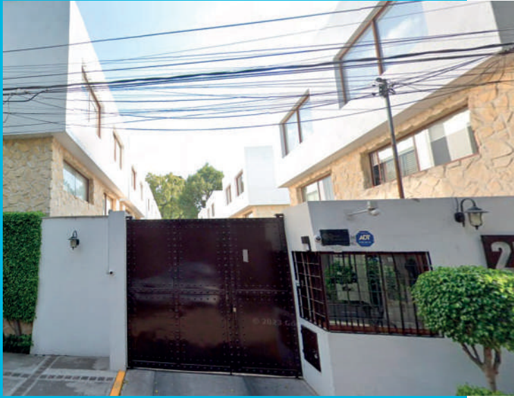
Naranjo 25, Florida, Álvaro Obregón, 01030 Ciudad de México, CDMX