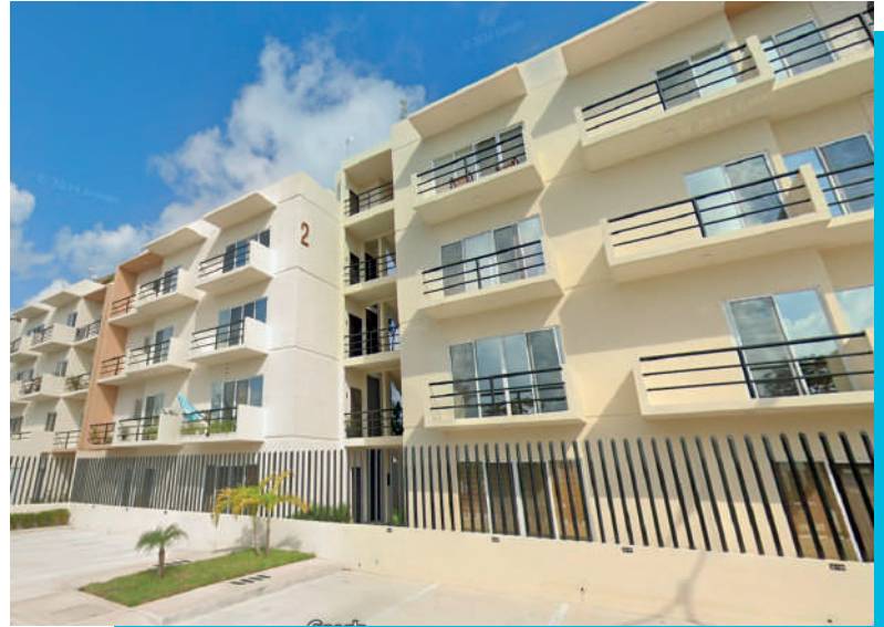
Puerto Morelos - Cancún