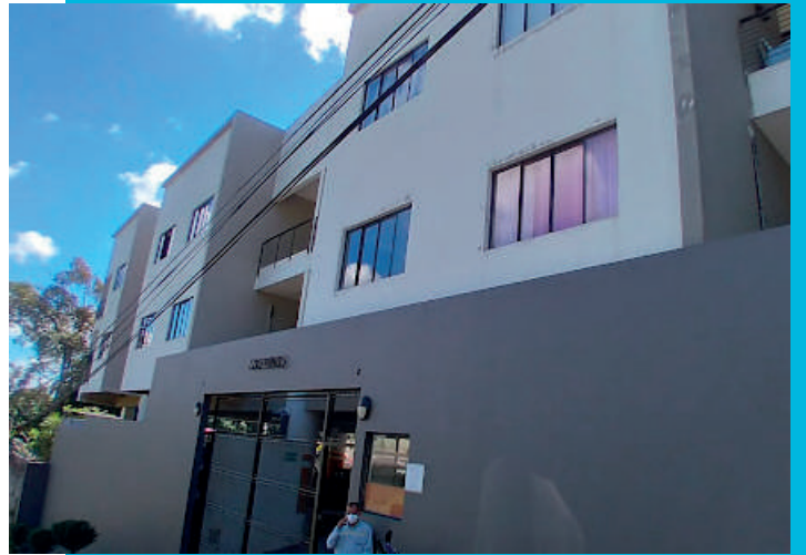
CONDOMINIO LOS PINOS