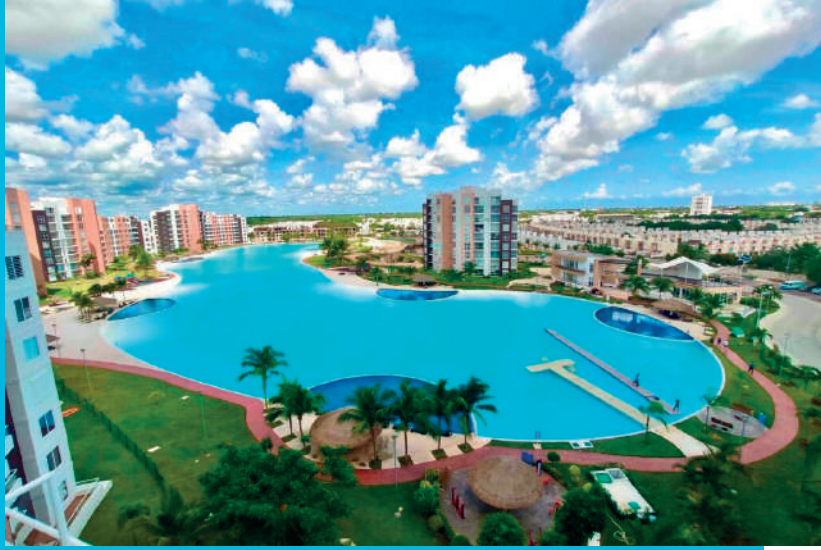
Dreams Lagoon - Cancun - Torre B