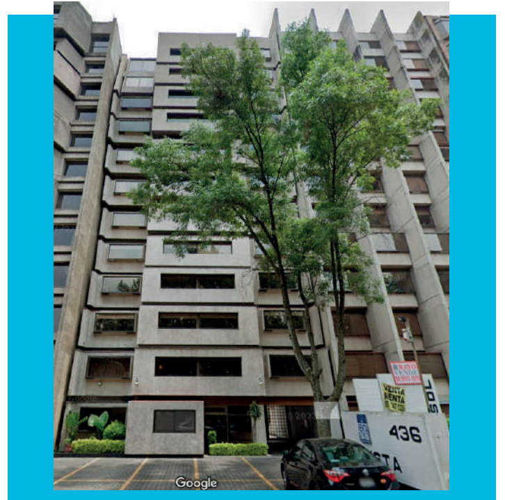
Cto. Fuentes del Pedregal 436, Fuentes del Pedregal, Tlalpan, 14140 Ciudad de México, CDMX