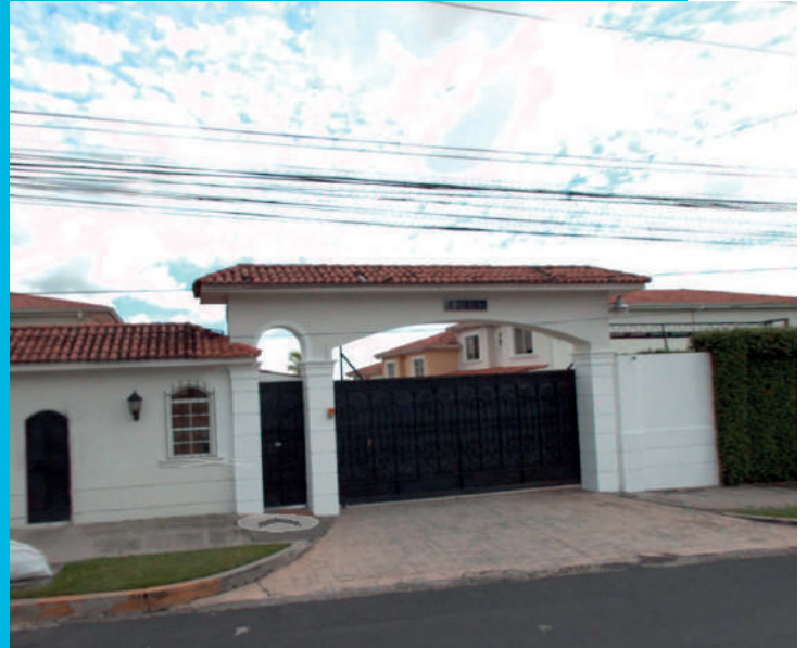
C. La Mascota 452, San Salvador, El Salvador