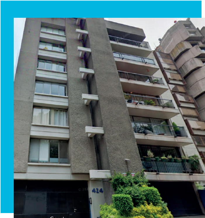
Cto. Fuentes del Pedregal 424 Fuentes del Pedregal, Tlalpan, 14140 Ciudad de México, CDMX