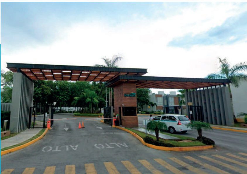
Privada Rivera - Playa del Carmen