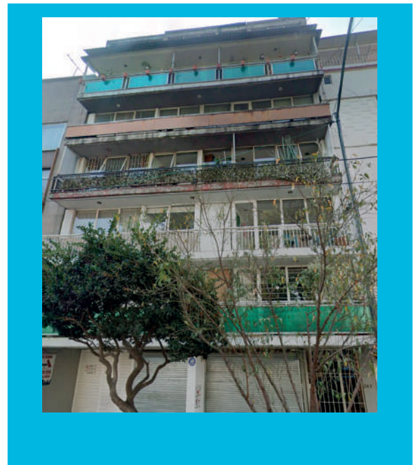
Casa del Obrero Mundial 243, Col del Valle Nte, Benito Juárez, 03103 Ciudad de México, CDMX