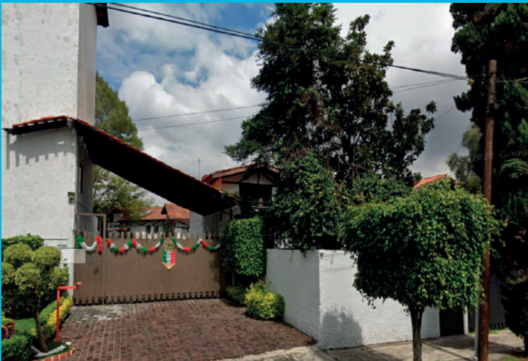
Joya 233, Valle Escondido, Tlalpan, 14600 Ciudad de México, CDMX