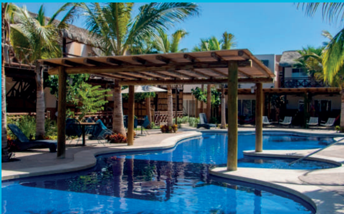
Punta esmeralda Grand, Punta Arena, Almarena (Isla de Cortés)