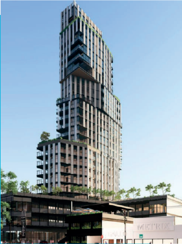
Torre Masaryk ABA center